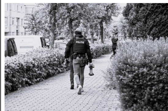
Aanhoudingen "flinke hoeveelheid" drugs in woning Huizen.

Door een goede samenwerking met de politie is ons onderzoek gevoegd bij het dossier van de politie en overgedragen aan justitie.