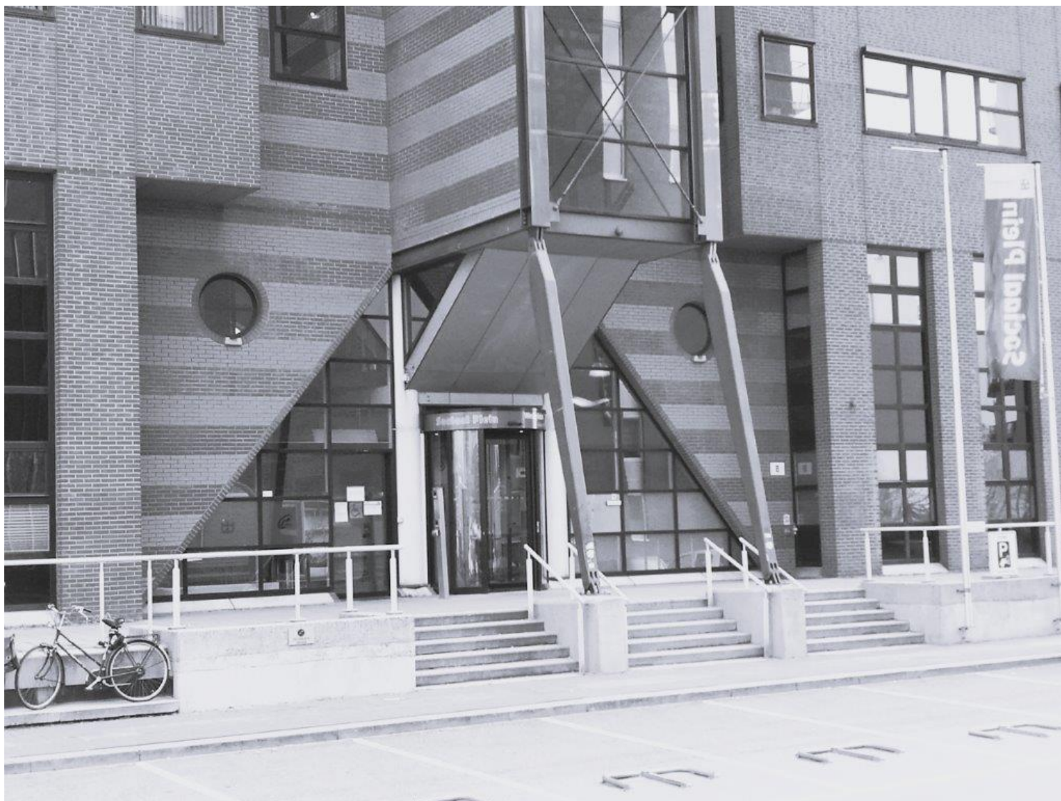
Sociaal Plein Hilversum