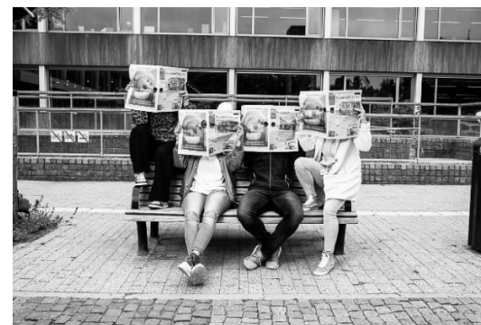
Foto: Vacature Handhavers voor Regionaal Handhavingsteam Gooi en Omstreken

Vanaf 1 oktober 2023 t/m 31 december 2023 zijn er 100 aanvragen voor Hilversum en Gooise Meren voor bijstandsuitkering binnen gekomen. Van deze 100 aanvragen lopen er nog 39 aanvragen, zijn er 38 aanvragen toegekend, 1 pakt de inkomensconsulent zelf op, 12 aanvragen ingetrokken, 10 buiten behandeling gesteld, met een totaalbedrag van € 333.473,76 aan besparing.