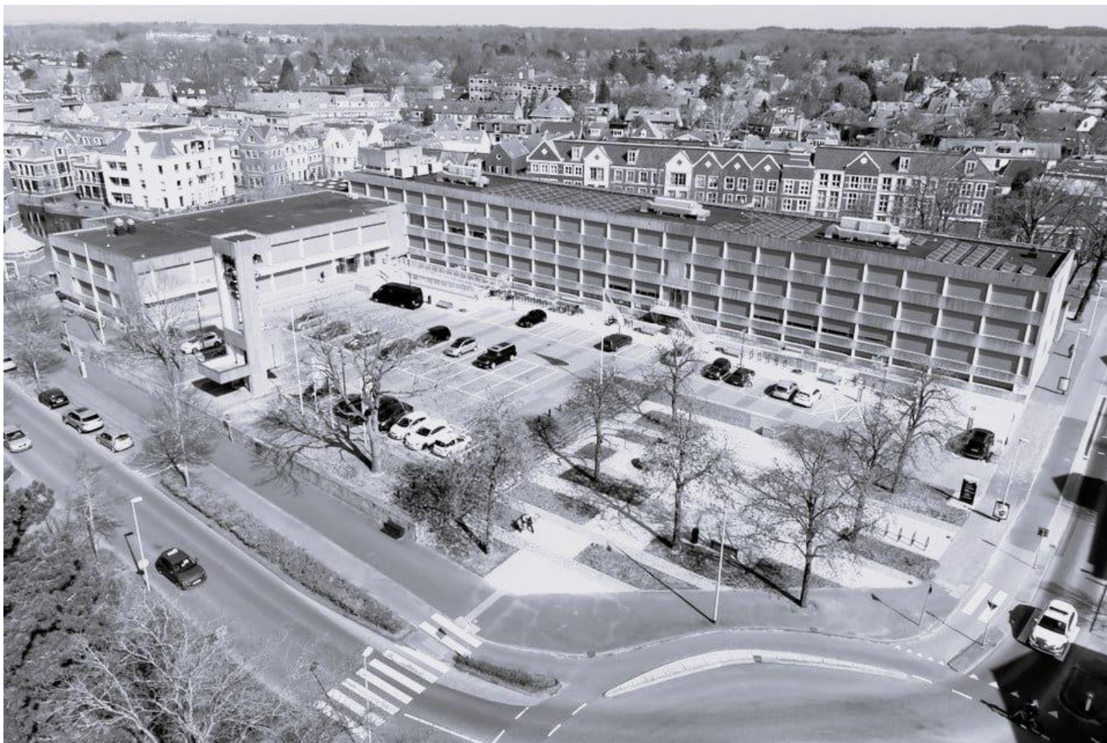
Gemeentehuis Gooise Meren