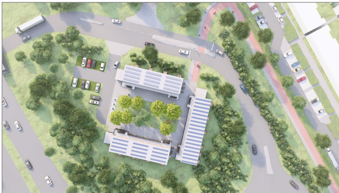
Figuur 1. Impressie van het bovenaanzicht van de huisvesting aan de Diemerdreef

Conform de Omgevingswet dient op het gebied van omgevingsveiligheid rekening gehouden te worden met de geldende aandachtsgebieden. In deze rapportage worden de resultaten van de kwalitatieve beoordelingen gepresenteerd.